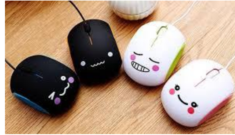
Chuột máy tính